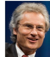
Dr. Henning Kagermann CEO SAP AG