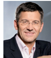
Herbert Hainer CEO adidas AG